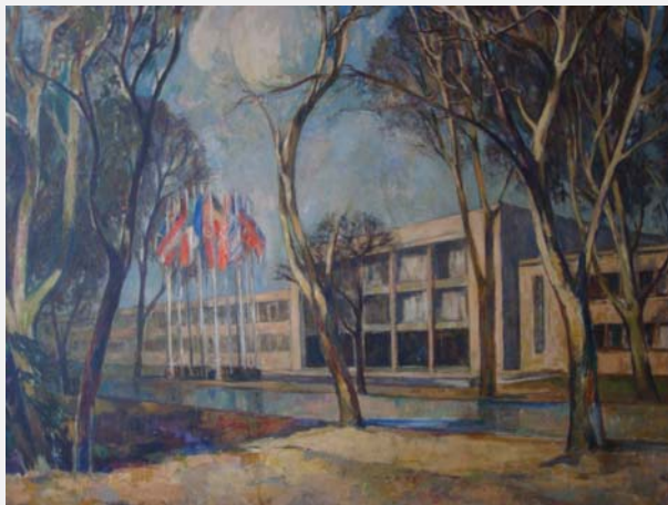
Het enig bestaande schilderij van het eerste gebouw van de Raad van Europa

L Het is nog maar enkele maanden geleden dat we, na de Algemene Ledenvergadering, in nov. vorig jaar de prachtige film Sonny boy hebben vertoond, over de liefde tussen een Surinaamse student en een gescheiden Nederlandse vrouw. De gevoelige en trieste geschiedenis speelde zich af in de jaren vòòr en in de tweede Wereldoorlog. De ouders van Sonny Boy komen tragisch om, Sonny boy zelf overleeft.